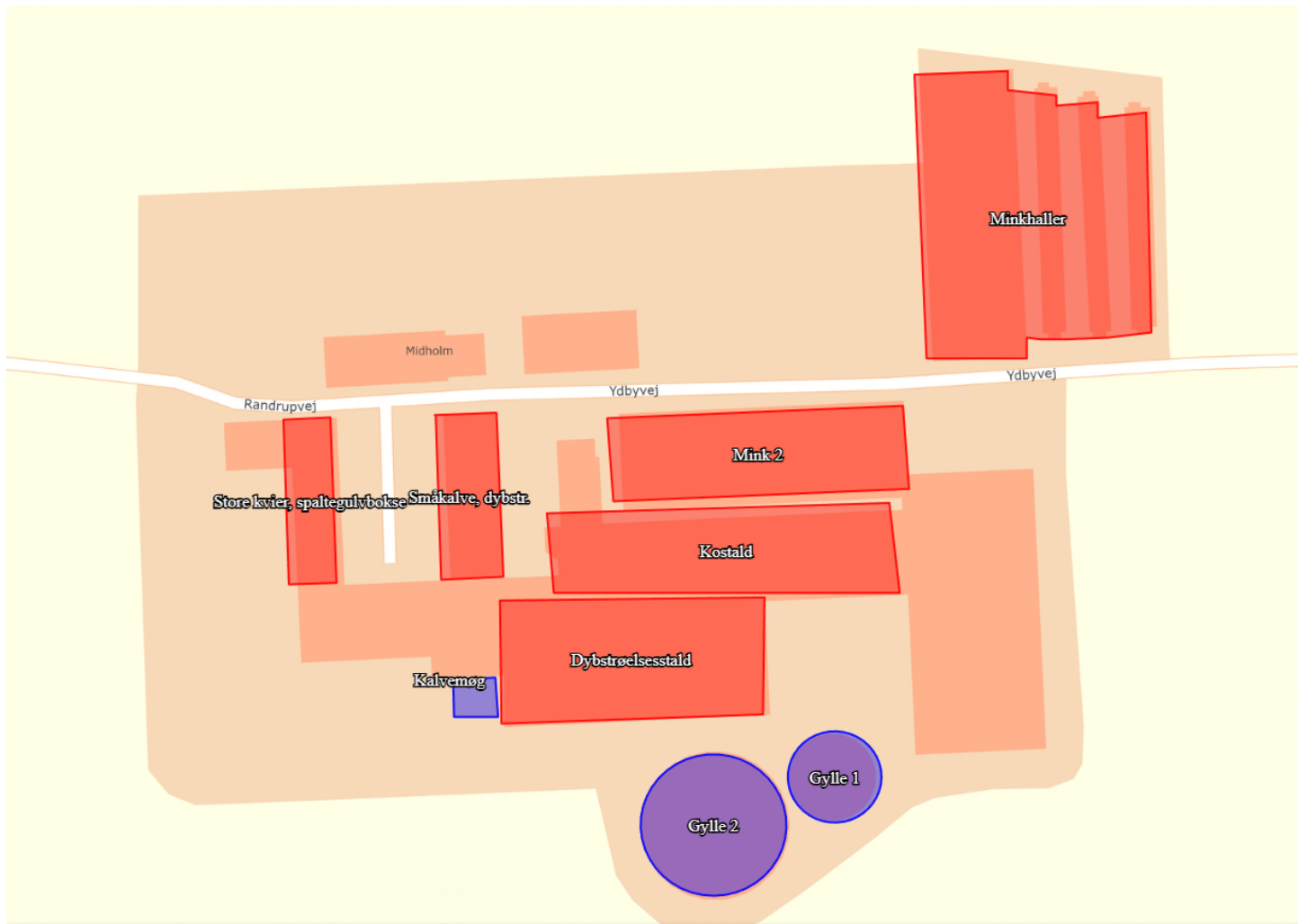
Bilag 1: Oversigtskort over staldanlæg.